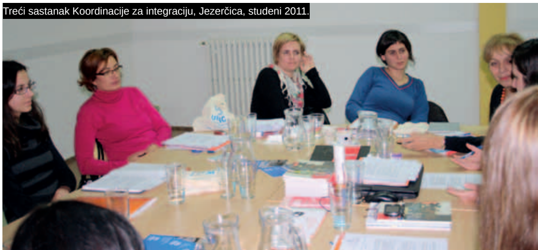
Treći sastanak Koordinacije za integraciju, Jezerčica, studeni 2011.