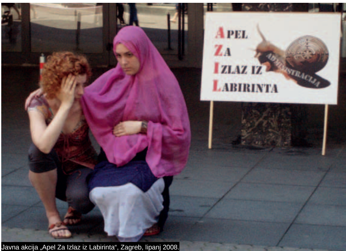
Javna akcija „Apel Za Izlaz iz Labirinta“, Zagreb, lipanj 2008.