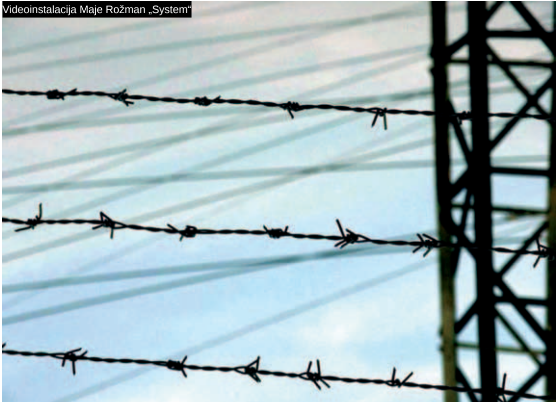
Videoinstalacija Maje Rožman „System“

Fotografije izloženih radova objavljene su u planeru za 2006. godinu s napomenom: Isplanirajte kako ćete promijeniti svijet ove godine. Planer sadrži i popis datuma kojima se obilježavaju važni događaji u prošlosti kojima su potaknute neke pozitivne društvene promjene te citate poznatih pjesnika, pisaca, filozofa, političkih aktivista.