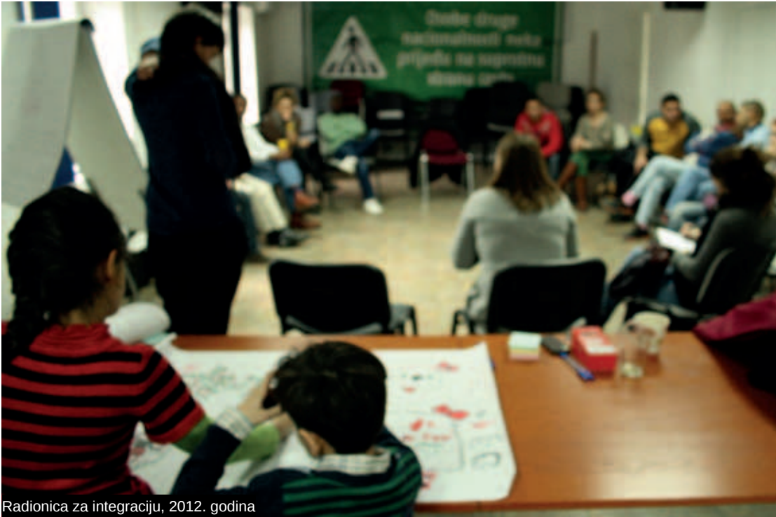
Radionica za integraciju, 2012. godina

Osim što su izbjeglice imali mogućnost kontinuirane edukacije i učenja hrvatskog jezika, kao i mogućnost konzultacija, pravnog savjetovanja i direktne asistencije kod integracije i uključivanja u društvo, posebno veseli što su neki od njih sami pokazali povećan interes za pomoć u integraciji drugih izbjeglica pa su stoga i sami bili dio CMS-ova tima. Dosad su tako u sklopu Info-pointa na puno radno vrijeme bila zaposlena dvojica azilanata u sustavu obavljanja javnih radova. Tako su bili uključeni i u edukacijske i inforadionice o različitim temama koje pokrivaju, primjerice, aspekte zapošljavanja ili socijalne skrbi izbjeglica. U sklopu Info-pointa od 2012. kvartalno se organiziraju i tematski sastanci Koordinacije za integraciju koji su prošireni temama integracije stranaca u društvima primitka pa su tako gostujući predavači diskutirali o specifičnim temama poput modela integracije, o položaju žena izbjeglica i o maloljetnim strancima bez pratnje kao tražiteljima azila. Ovo su vrlo važne aktivnosti usmjerene na integraciju izbjeglica kroz umrežavanje, izgradnju kapaciteta, treninge i direktan rad s osobama pod zaštitom.