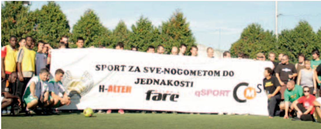
Malonogometni turnir „Sport za sve - nogometom do jednakosti“, Zagreb, listopad 2012.

marginaliziranih grupa, kao i ostalih građana i građanki Zagreba doprinijelo je boljem upoznavanju i informiranju o rasizmu, homofobiji i diskriminaciji u Hrvatskoj.