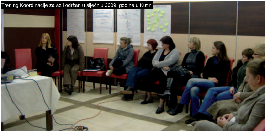
Trening Koordinacije za azil održan u siječnju 2009. godine u Kutini

U suradnji s koordinacijom udruga planirali smo proširiti direktan rad s tražiteljima azila sljedećim sadržajima: tečajevima za stjecanje osnovnih IT vještina, pružanjem psihosocijalne pomoći korisnicima centra, organizacijom kulturnih i vjerskih događaja u centru i održavanjem kreativnih radionica za djecu i mlade te radionica za odrasle prema njihovim specifičnim potrebama. Težili smo uspostaviti operativnu koordinaciju organizacija civilnog društva i institucija iz lokalne zajednice i šire u domeni razvoja socijalnih usluga za tražitelje azila te stalnu informiranost tražitelja o sustavu azila i načinima integracije tražitelja azila. Ispitali smo i načine formalizacije koordinacije i održivosti njezina djelovanja.