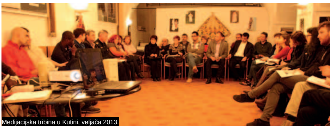
Medijacijska tribina u Kutini, veljača 2013.

U atmosferi otvorenog, ponekad i uzavrelog dijaloga, čula su se razna mišljenja, nerijetko frustracije i strahovi koju je izražavalo lokalno stanovništvo, ali i optužbe na račun izvršnih vlasti koje nisu poduzele dovoljno da se održi model inkluzije i senzibilizacije provede. Ipak, medijacija je dovela do sagledavanja problema iz više kutova, a iskristalizirali su se i neki konkretni prijedlozi i mjere koji bi trebali konsenzualno zadovoljiti potrebe svih strana. Slična je tribina održana u lipnju 2013. u Dugavama, a bila je popraćena i akcijama informiranja građana lecima, predavanjem i diskusijom na temu azila za crkvenu pastvu u lokalnoj zajednici (zagrebačko naselje Siget) te promoviranjem održivosti interakcije stanovnika s izbjeglicama.