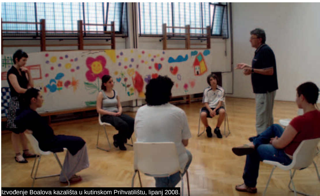
Izvođenje Boalova kazališta u kutinskom Prihvatilištu, lipanj 2008.