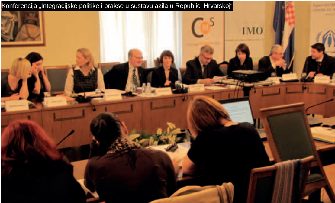
Konferencija „Integracijske politike i prakse u sustavu azila u Republici Hrvatskoj“

Nakon osam godina javnog zagovaranja (nažalost često i prigovaranja) zbog neaktivnosti državnih tijela i institucija koje se trebaju baviti integracijom izbjeglica, CMS je napravio analizu koja je predstavljala rekapitulaciju dosad učinjenog po pitanju integracije. Javnozagovarački potencijal i dalje je upućivao na potrebu sustavnijeg međusektorskog povezivanja i provođenja mjera integracije. Istraživanje je nastalo u okviru projekta CMS-a „Potpora integraciji izbjeglica“, koji se izvodi u partnerstvu s UNHCR-om u Hrvatskoj, te je rezultiralo objavom publikacije „Integracijske politike i prakse u sustavu azila u Republici Hrvatskoj: Uključivanje azilanata i stranaca pod supsidijarnom zaštitom u hrvatsko društvo“. Ono je posebice analiziralo tri modela integracije (asimilacija, multikulturalizam i interkulturalizam) i načina na koji ti modeli uređuju različita područja života izbjeglica i stranaca u smislu njihove integracije u društvo u koje dolaze. Istodobno je donijelo daljnje preporuke i mišljenja aktera u sustavu azila, kao i transkript s istoimene konferencije održane u Hrvatskom saboru 20. ožujka 2012.