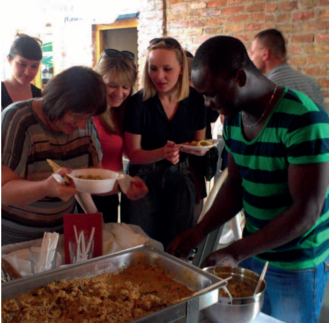
Okusi doma, degustacija azilantskih i domaće kuhinje, svibanj 2013.

U posljednjih nekoliko godina posvećeni smo kulinarskoj razmjeni i izradi kuharice „Okus doma“. Ovaj istraživačko-gastrološki projekt teži upoznavanju s kulturom, običajima i društvima porijekla azilanata u Hrvatskoj bilježenjem njihovih sjećanja na dom, mirise i okuse njihove nacionalne i lokalne kuhinje. Ovom je projektu cilj ponajprije družiti se te razmjenjivati životna i kulinarska umijeća azilanata i ljudi iz Hrvatske, ali se posredno i bolje upoznati, razumjeti i poštovati u svom bogatstvu različitosti. Jedan su od rezultata projekta dvije realizirane tematske kulinarske radionice kuhanja afričkih, azijskih i europskih specijaliteta uz međusobno podučavanje i javnu degustaciju. Projekt je rezultirao i kuharicom čija je izrada u procesu, a osim recepata, sadržavat će i zabilježena životna iskustava izbjeglica, kulturološke sličnosti i razlike, osnovne podatke o prilikama i posebnostima u zemljama porijekla iz kojih azilanti dolaze i mirise čijih kuhinja u Hrvatskoj oživljavaju. Uz životne priče izbjeglica i razmjenu njihovih kulinarskih specijaliteta, želimo približiti hrvatskim građanima druge kulture i umanjiti nelagodu i diskriminaciju osoba različite boje kože, vjeroispovijesti i jezika.