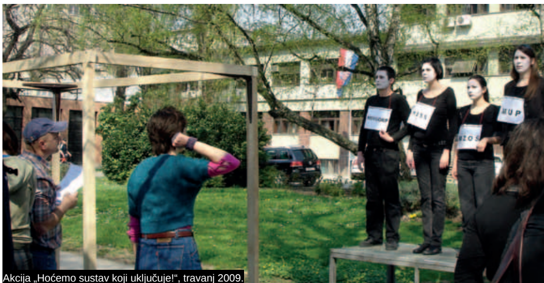
Akcija „Hoćemo sustav koji uključuje!“, travanj 2009.

CMS dugi niz godina aktivno sudjeluje u obilježavanju svjetskog Dana izbjeglica (20. lipnja) kao i svjetskog Dana migranata (18. prosinca). Uz standardne izjave za javnost i medijske istupe CMS se uvijek odazivao na okrugle stolove koje tom prigodom tradicionalno organizira UNHCR-ov ured u Zagrebu, ali i neke javne tribine koje je povodom tog dana organizirao primjerice Centar za kulturu Trešnjevka 23 . CMS je 2007., kao i 2009. organizirao benefit partyje na kojima su građani imali priliku saznati nešto o azilu u Hrvatskoj iz javne diskusije, prezentacije rezultata istraživanja, iz tiskanih promomaterijala i publikacija, prezentacije filmova i videomaterijala o azilu u Hrvatskoj, ali ponajviše u direktnom kontaktu i dijalogu sa samim izbjeglicama. Ta su događanja za svrhu imala i prikupljanje materijalnih priloga za pomoć samim azilantima i tražiteljima, a jednom su prilikom bili izloženi i umjetnički slikarski radovi tražitelja azila s Kosova. 24 Naročito su važni načini obilježavanja tog dana koji svojom porukom nastoje upozoriti da problematika izbjeglištva i nedaće s kojima se suočavaju izbjeglice traju svih 365, a ne samo jedan dan u godini.