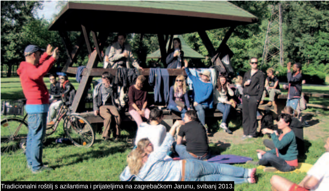
Tradicionalni roštilj s azilantima i prijateljima na zagrebačkom Jarunu, svibanj 2013.

Uspostavom suradnje CMS-a i Bijelih anđela 25 , kao i prijateljstvom i poznanstvima samih navijača s tražiteljima azila i azilantima, nastavila se dobra interakcija i druženje koji su otprije njegovani u projektu „Stop rasizmu na tribinama“, a kojim se tradicionalno obilježava tzv. FARE - Football Against Racism in Europe, tj. Tjedan borbe protiv rasizma u nogometu u Europi. Na turniru u malom nogometu u listopadu 2011. igrale su ekipe Bijeli anđeli, azilanti i tražitelji azila, Udruga mladih antifašista grada Zagreba „Antifa“, Q(ueer)-Sport i Centar za mirovne studije. Turnir nije bio natjecateljskog karaktera, već smo igru između timova različitih (diskriminiranih) skupina htjeli iskoristiti kao sredstvo za promoviranje socijalne integracije azilanata i tražitelja azila, naglašavanje bogatstva različitosti i poticanje većeg razumijevanja problema s kojima se pojedine skupine suočavaju. Pozitivan ishod ove suradnje obilježen je i daljnjim neformalnim sportskim druženjima – nogomet, košarku i odbojku koje organiziraju sad prijatelji, izbjeglice i navijači. 26 Već 2013. godine na turniru organiziranom u sklopu FARE Action Weeka, u projektu „Sport za sve – nogometom do jednakosti“ 27 , na turnir se odazvalo deset timova među kojima i profesionalni malonogometni klub Petrova Gora. Cjelodnevno druženje aktivista, navijača, izbjeglica, pripadnika nacionalnih manjina i različitih drugih