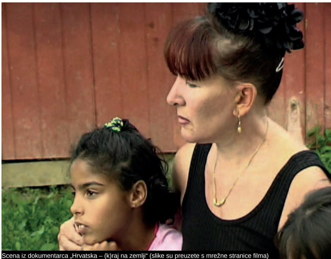
Scena iz dokumentarca „Hrvatska – (k)raj na zemlji“

Prije smo, a ponajviše u samoj kampanji „Hrvatska – (k)raj na zemlji“ počeli sustavno i direktno raditi s tražiteljima azila poučavajući ih hrvatski jezik i kulturu, slušajući i dokumentirajući iskustva, priče o porijeklu i stradanjima izbjeglica, organizirajući kazališne radionice za odrasle i djecu, razmjenu knjiga, druženja i druge aktivnosti. Osim toga, objavili smo dva izdanja za izbjeglice korisnog priručnika „Institucionalni vodič za tražitelje/ice azila“ 15 . On je tiskan kao višejezično izdanje na sljedećim jezicima: hrvatski, engleski, francuski, arapski, turski, hindu, albanski, farsi. U sebi je sadržavao osnovne informacije o proceduri za azil, pravima i obvezama tražitelja azila tijekom postupka i po odobrenju zahtjeva, adresar i imenik nadležnih institucija i organizacija u sustavu azila te pregled osnovnih podataka o društvenom i političkom uređenju Republike Hrvatske s glavnim kulturnim i drugim obilježjima.